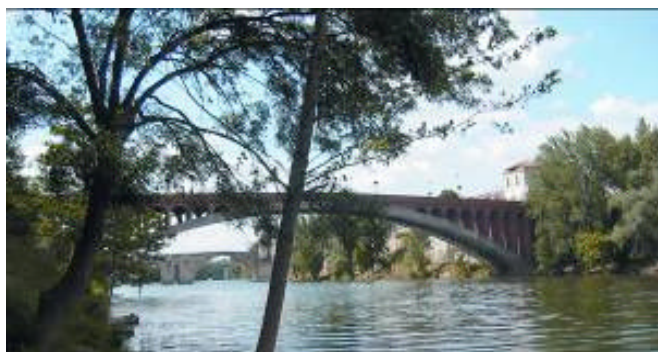
Le Pont de Villeneuve sur Lot

18 h 30 : Retour à l'aéroport de Toulouse Blagnac Départ pour Paris Orly Ouest par le Vol AF 6145 de 19 h 45