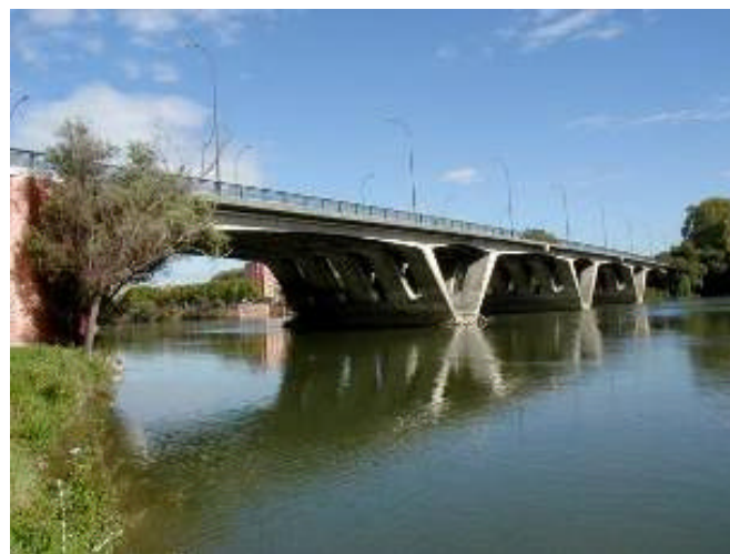
Le Pont Saint Michel à Toulouse