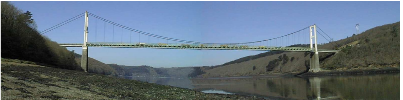
L'ancien pont de Térénez

Le pont de Térénez est situé sur la route reliant la presqu'île de Crozon au pays de Brest ; il est destiné à enjamber la rivière Aulne, large à cet endroit de presque 300 m. Il va remplacer l'ouvrage actuel, qui fût le plus grand pont suspendu d'Europe lors de son édification en 1925.