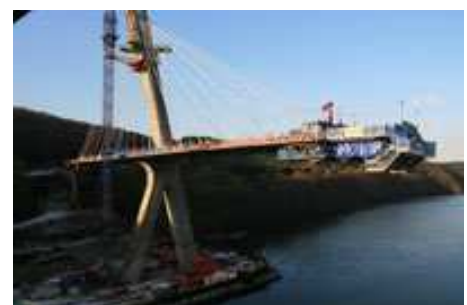
Chantier du nouveau pont