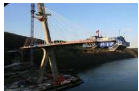
Chantier du nouveau pont