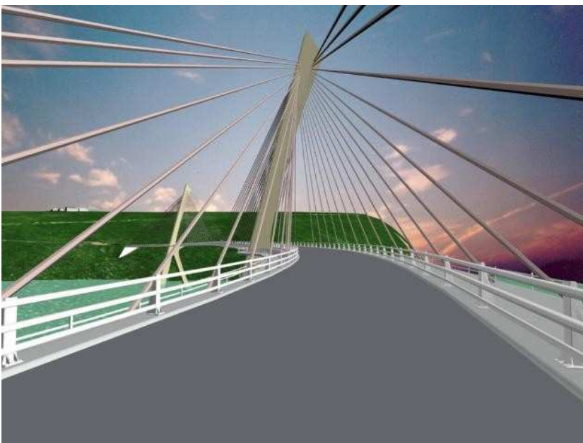
Image de synthèse du nouveau pont de Térénez

L'AFGC a déjà organisé en octobre 2008 une journée technique consacrée au nouveau pont de Térénez. Cette première visite a été consacrée essentiellement aux travaux de fondations et de démarrage des pylônes. Cette nouvelle visite permettra de découvrir les deux pylônes quasiment terminés, le tablier en cours de construction et la pose des haubans.