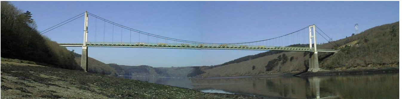
L'ancien pont de Térénez

Le pont de Térénez est situé sur la route reliant la presqu'île de Crozon au pays de Brest ; il est destiné à enjamber la rivière Aulne, large à cet endroit de presque 300 m. Il va remplacer l'ouvrage actuel, qui fût le plus grand pont suspendu d'Europe lors de son édification en 1925.