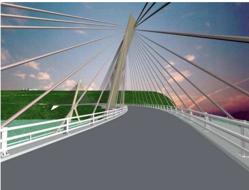
Image de synthèse du nouveau pont de Térénez

L'AFGC a déjà organisé en octobre 2008 une journée technique consacrée au nouveau pont de Térénez. Cette première visite a été consacrée essentiellement aux travaux de fondations et de démarrage des pylônes. Cette nouvelle visite permettra de découvrir les deux pylônes quasiment terminés, le tablier en cours de construction et la pose des haubans.